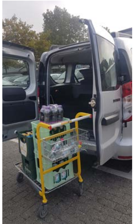
Extrem praktisch beim Einkauf sind die beiden großen Heckklappen.

Praktisch und komfortabel für Alltagsfahrten Der Dacia Dokker ist das erste echte Freizeitfahrzeug in der Dacia-Palette. Da er so vielseitig und praktisch ist, passt er sich all Ihren Anforderungen an, egal ob sie mehr Platz für Fahrgäste oder einen größeren Laderaum benötigen. Der Kofferraum des Dacia Dokker bietet mit 1,16 m viel Ladefläche. Mit seinen umklappbaren Rücksitzen kann sehr